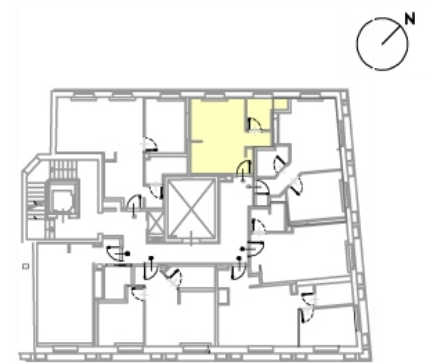
via Milano 43